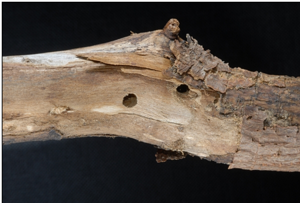
Ryc. 3. Obraz żerowania P. novaki na pędzie głównym E. dendroides.

Część imagines była już przeobrażona w kolebkach poczwarkowych i gotowa do opuszczenia żerowisk, a pozostałe wyhodowano z poczwarek i larw znajdujących się w drewnie. Larwa początkowo żeruje między korą a drewnem, silnie naruszając biel. Następnie część z nich wgryza się w drewno i tam tworzone są kolebki poczwarkowe. Inne tworzą je na powierzchni drewna pod korowiną. Imagines wychodzą wcześniej wygryzionym, okrągłym otworem o średnicy około 4,5mm. Otwór wejściowy zatkany jest zatyczką z długich wiórków (ryc. 3.). Postacie doskonale przebywają zazwyczaj na materiale lęgowym, chowając się za dnia we własne otwory wylotowe. Prowadzą nocny tryb życia. Imagines odżywiają się korowiną obumierających roślin żywicielskich. W warunkach laboratoryjnych przeżywają ponad rok.