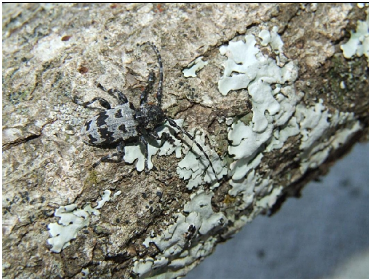
Ryc. 5. Aegomorphus krueperi na gałęzi Quercus frainetto , jako przykład mimikry.

Gatunek znany, jako endemit Grecki. Ostatnio błędnie wykazany został z Serbii przez Pila (2004/2005) oraz Pila i Stojanovića (2005, 2007) (Sama 2010). W Grecji został stwierdzony w prowincji Trikala: Meteora – w litych drzewostanach dębowych Quercus frainetto Tan. Znany jest także z Góry Ossa w prowincji Larisa (Berger 2005). Imagines prowadzą bardzo skryty tryb życia. Najczęściej przebywają na leżącym na ściółce, martwym materiale drzewnym, który porośnięty jest dużą ilością porostów. Ich ubarwienie sprawia, że z łatwością się do nich upodabiają – mimikra (ryc. 5.). Atrakcyjnym dla tego gatunku materiałem drzewnym było drewno silnie przegrzybione, głównie przez patogeny z rodzaju Stereum spp. Z obserwacji własnych wynika, że A. krueperi , prowadzą żer uzupełniający zgryzając fragmenty drewna przerośnięte grzybnią (zgnilizna biała-twarda), a także niekiedy fragmenty plechy porostów. Dopiero później następuje kopulacja, a jaja składane są w spękania korowiny. Podobnie zachowuje się pokrewny gatunek o podobnej biologii A. obscurior (Pic, 1904), niedawno znaleziony na terenach Polski (Hilszczański i Bystrowski 2005). Podjęte próby hodowli laboratoryjnych różnych stadiów przedimaginalnych wskazują na rozwój jednoroczny, czasami w mniej sprzyjających warunkach dwuletni. Imagines niechętnie latają, żyją krótko, około 2-3 tygodni.