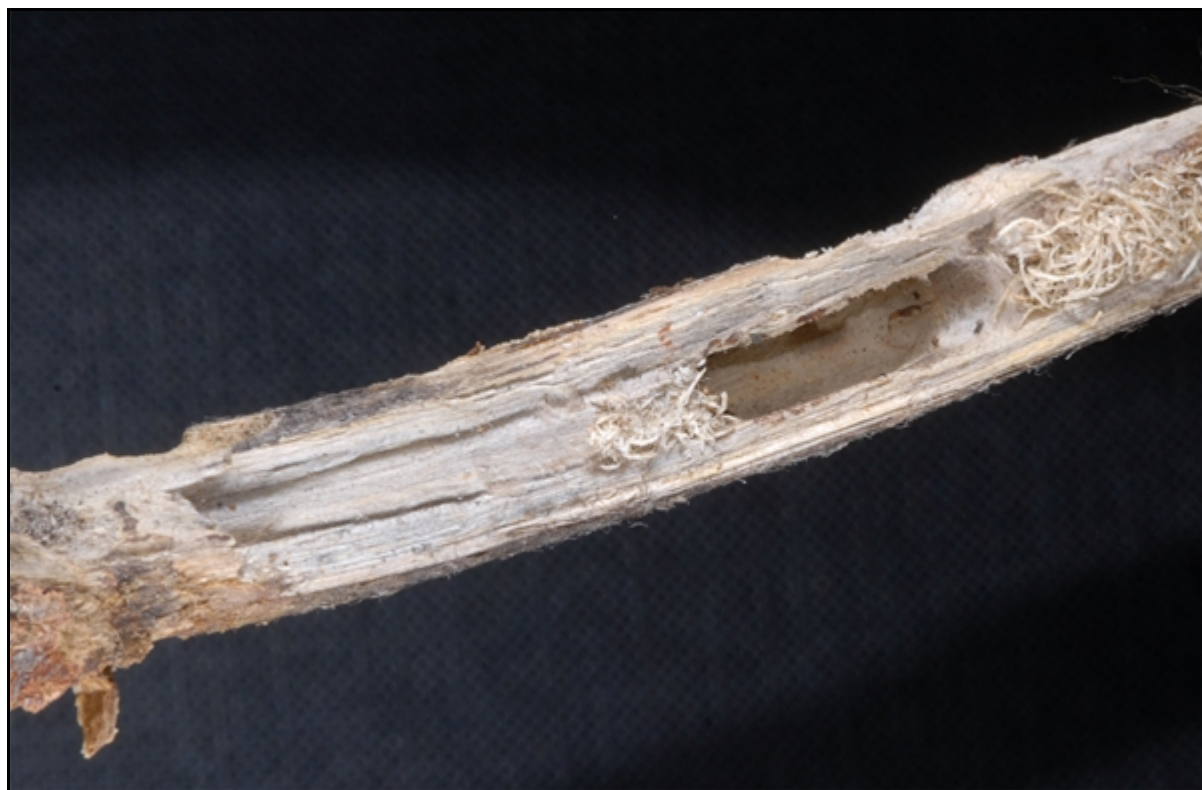
Ryc. 4. Kolebka poczwarkowa P. pubescens pilosa w pędzie E. characias wulfenii.

się do środka pędu, żerując przez cały okres wzdłuż rdzenia. Pędy usychając – drewnieją. Niektóre osobniki potrafią cały cykl odbyć na powierzchni pędu, naruszając tylko biel. Kolebka poczwarkowa (o wymiarach 14 mm × 5,5 mm) tworzona jest zazwyczaj wzdłuż rdzenia (ryc. 4.), choć niekiedy (u mniejszych osobników) w części obwodowej. Imagines wygryzają się okrągłym otworem o średnicy około 5mm. Imagines prowadzą nocny tryb życia i jak u poprzedniego gatunku stwierdzono również, że długość życia w warunkach laboratoryjnych przekracza rok czasu. Inne znane rośliny żywicielskie to: E. dendroides L., Crithmum maritimum L., Foeniculum vulgare Mill., Ferula communis L., Thapsia garganica L., Ammi visnaga (L.), Chrysanthemum L. sp., Papaver somniferum L., Carduaceae , a także drzewiaste Ficus carica L. i Nerium oleander L. (Bense 1995).