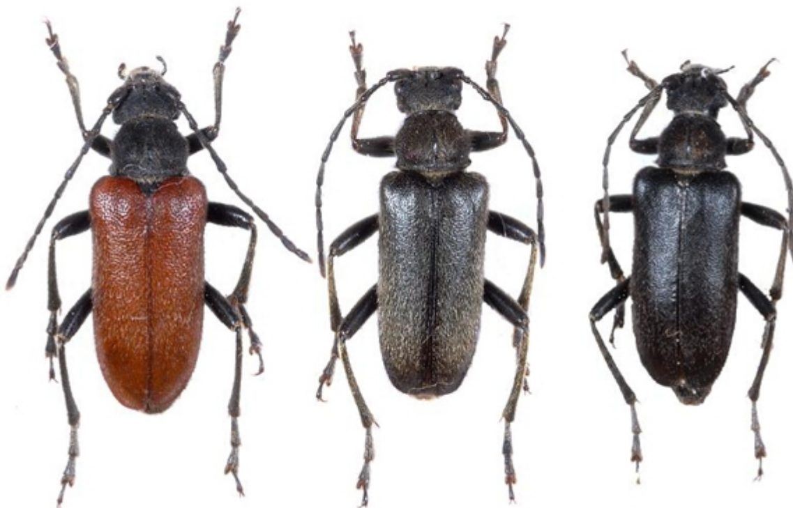
Ryc. 2. C. holosericea w różnych formach barwnych.

Gatunek szeroko rozmieszczony, znany z Włoch, Austrii, Bośni i Hercegowiny, Serbii i Montenegro, Czech, Słowacji, Rumunii, Węgier, Bułgarii, Chorwacji, Niemiec, Ukrainy, Słowenii, południowej części Rosji, Kaukazu i Turcji (Sama 2002, Simandl 2002, Özdikmen 2007, Miroschnikov 2009, Sama i Löbl 2010a). W Grecji stwierdzony został na północno-zachodnim stoku masywu Olimp na wysokości 1500m n.p.m. Imagines (ryc. 2.) żerowały na Centaurea triumphettii All., pobierając z nich pyłek kwiatowy.